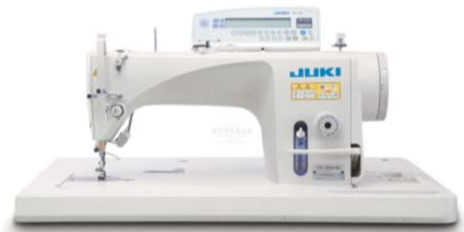
Рисунок 1 – Общий вид швейной машины

На рисунке 2 приведена схема двухниточного челночного переплетения, класс 300. Прямолинейная строчка, тип 301.