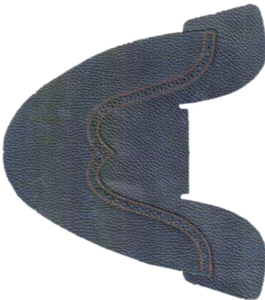
Рисунок 3 – Заготовка, собранная на полуавтомате ПШ-1

Результаты замеров затрат времени на выполнение операций сборки заготовок верха обуви сравнивались с данными технологического маршрута сборки изделия на СООО "Сан Марко". Установлено, что затраты времени на выполнение строчки при существующей технологией составляют 25 мин на 10 пар, а при автоматизированной – 10,5 мин, что в 2,38 раза меньше.