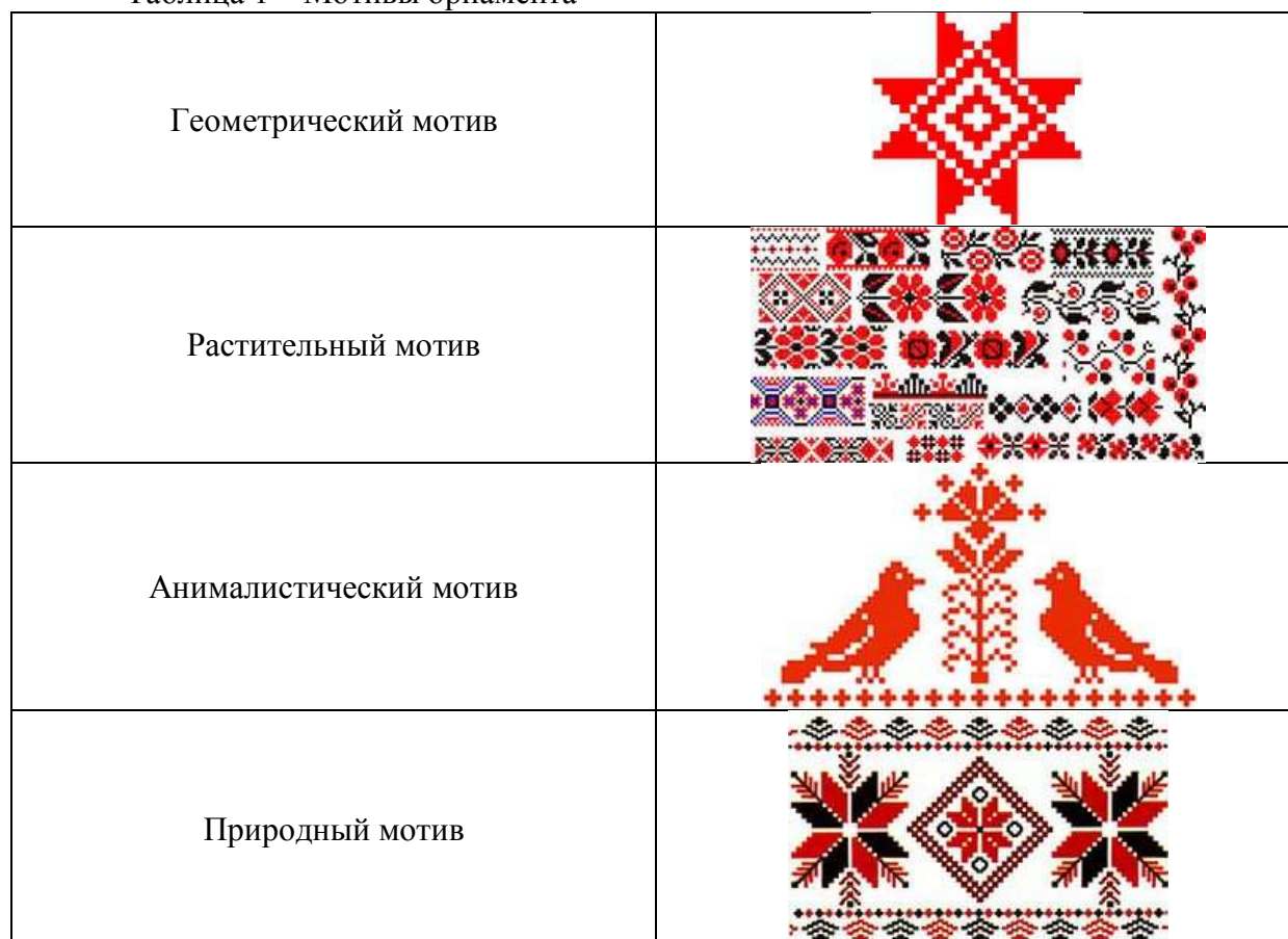
Таблица 1 – Мотивы орнамента

По смысловому содержанию выделяются обрядовые и декоративные элементы орнамента или их сочетание. Некоторые элементы Белорусского национального орнамента и их смысловые значения приведены в таблице 2.