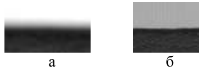
Рисунок 2 – Часть контура детали, полученная сканированием при закрытой (а) и при открытой (б) крышке сканера

2а). Если сканирование производить при открытой крышке, то тень не появляется (рис. 2б), однако воздействие внешнего освещения ухудшает качество изображения. Ширина полосы тени превышает толщину деталей, что не позволяет с достаточной точностью произвести оцифровку контура.